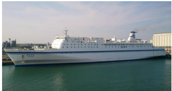
写真・苫小牧港に停泊中の「きたかみ」(入港するシルバーフェリー「シルバープリンセス」より撮影・2017年7月)

乗船する船と港、時間帯により乗船する場所は異なるが、通いなれたこの船へは、この日仙台港で舷門を過ぎエントランスの階段を上がり、案内所の内部へ入る。そこからカーテンで仕切られた角度の急激な階段を上り、船員区画であるスペースへと踏み入れる。最後に本船に乗務したのは 2000年、すでに 16年近くが経過していたが、不思議なもので、船舶の、しかも乗組員区画の独特の匂いは変わっていない。