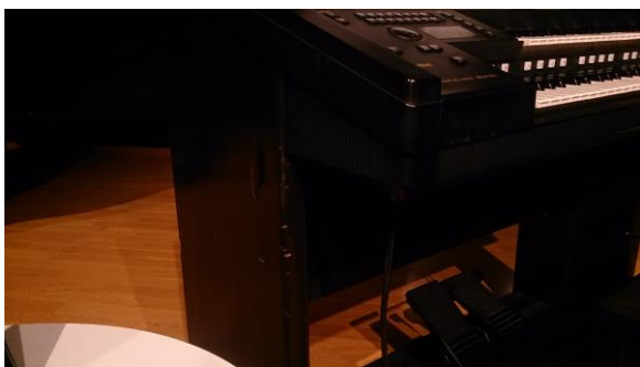
写真・きたかみに搭載の EL-900 に刻まれた傷(2016年)

それから数年、お互いのタイミングが合わずにいたものの、2016年1月、ついにそのときがやってきた。仙台～苫小牧一往復、氏のご協力により船上でステージを行えることになったのである。長く長く夢見続けた復活の日。乗船船舶は「きたかみ」。三隻就航しているなかでは最古参であり、私の初仕事だった思い出の船でもある。代替わりした他の二隻には船内の設備には及ぶべくも無いが、他の船より在籍期間が長いぶんお客様から大切にされてきた温かみがこの船にはある。