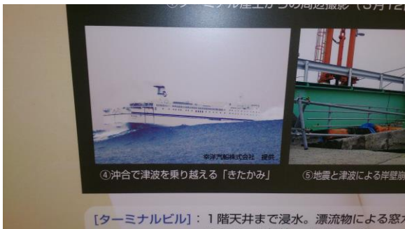
写真・苫小牧フェリーターミナルに展示されている写真

当時 20代だった私は 40代になり、頭に白髪も混じり始めてきた。また、当時最新鋭だった EL-900 は長い航海の間に多くの傷が刻まれていた。楽器に刻まれた傷は数知れない荒天に揉まれただけではあるまい。詳細は窺い知ることができないが、東日本大震災での大津波警報発令により保船のため本船が沖合に航行した際、エレクトーンもまた大津波に耐えたに違いない。