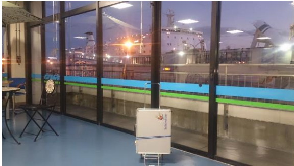
写真・きたかみと愛用キャリーケース、仙台港にて(2016年)

これは、太平洋フェリーの船上で私が演奏した際に、ステージで最後に述べる一言である。人間が、不特定の「まわりの人たち」と関わりを持ちながら生きる以上、人生にはもはや自分の力だけではどうにもならないことがある。それを思うとき、冒頭の「いつか」が、重くのしかかってくる。今回の投稿は活動報告という名の、私の人生史のようなものであるということをまずお断り申し上げる。